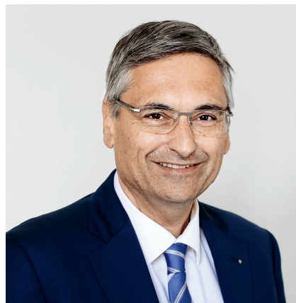
Guido Graf Regierungsrat Kanton Luzern Vorsteher des Gesundheits- und Sozialdepartementes

OdA S | Schärenmoosstrasse 77 | 8052 Zürich T 044 306 88 66 | info@oda-soziales-zuerich.ch